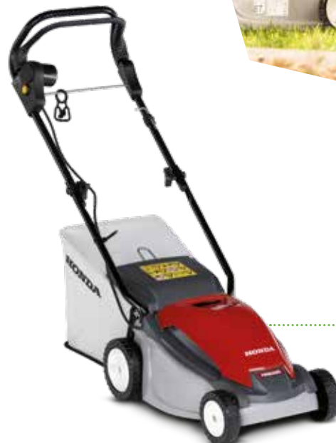
HRE 330 PLE

En magnetisk knivbromskoppling manövreras bekvämt från huvudhandtaget, vilket gör det enkelt att koppla in och ur skärbladen. Ett integrerat system med kabelslinga håller kabeln ur vägen så den inte skadas.