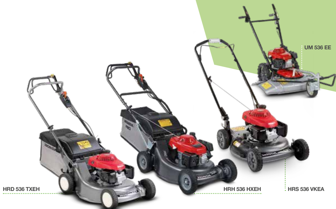
HRD 536 TXEH