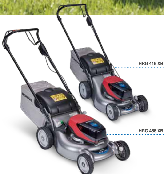
HRG 416 XB