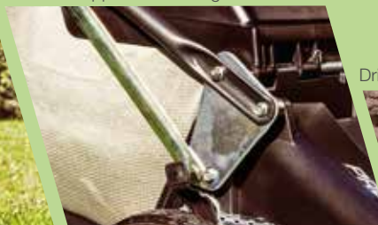
Drivaxel i gjutjärn