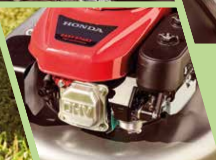
Motor för professionellt bruk GXV 160