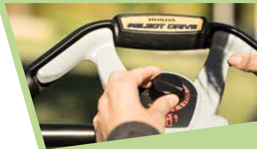
HRX 476 VYE