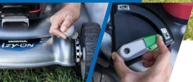
Höjdsjustering av klippkåpan