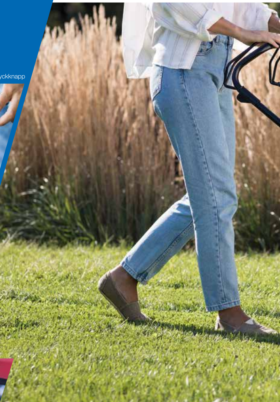
Versamow™ selektiv mulchning

Med en kraftfull, borstlös motor på 1,8 kW och ny batteriteknik sätter vår izy-ON ribban för batteridrivna gräsklippare.